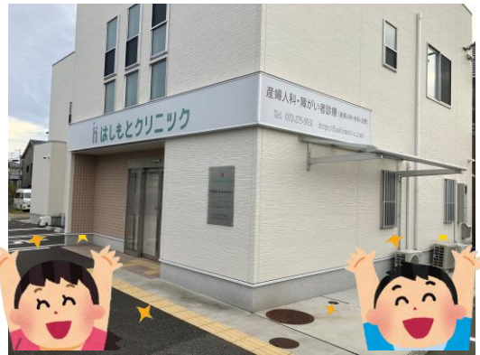
12. お疲れ様です 到着！！