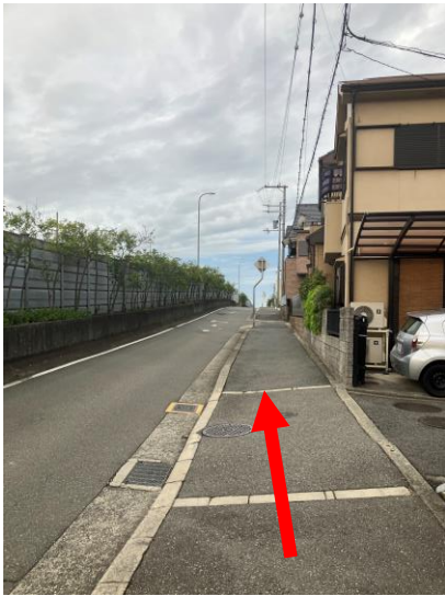
11. あともう少し！！ 少し坂を進む