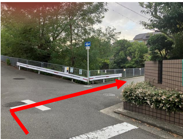
7. 池が見えると手前を右に曲がり池にそって歩く