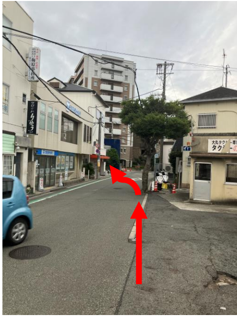
1. 上野芝駅東口（長次郎の方）おりて右に沿って歩く