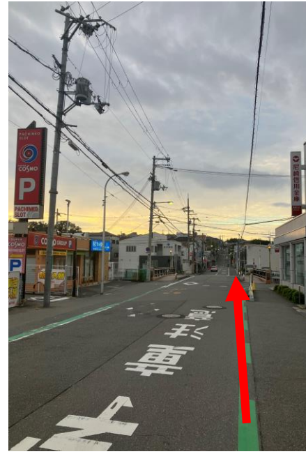
3. そのまま道なりに 川を渡って坂を上っていく