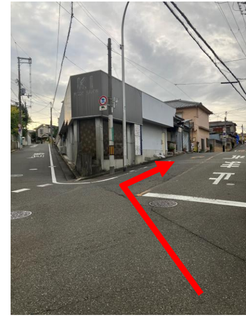
4. 坂の途中の十字路を右に曲がる