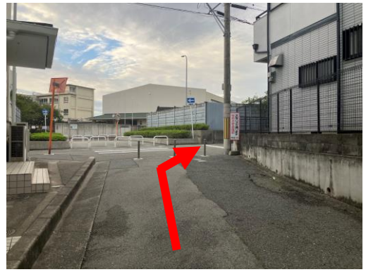
10. 道なりに曲がった坂を上って いくと中学校がバックに進 入禁止のポールが見える ポールのところを右に曲がる (自転車が走ってくるので気 をつけて)