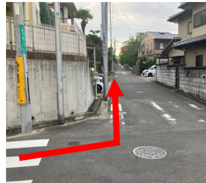
6. 信号を左に曲がる