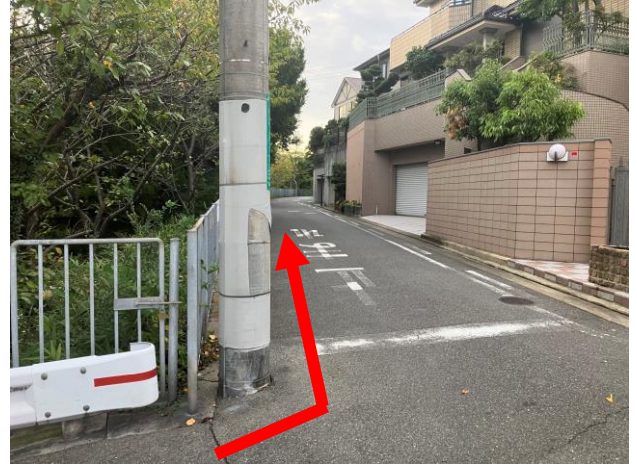
8. 池にそって左に曲がるそのまま池にそって歩く