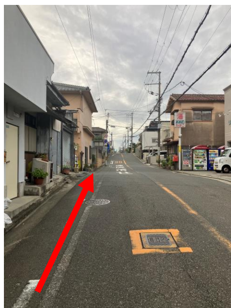
5. 一個目の信号までまっすぐ