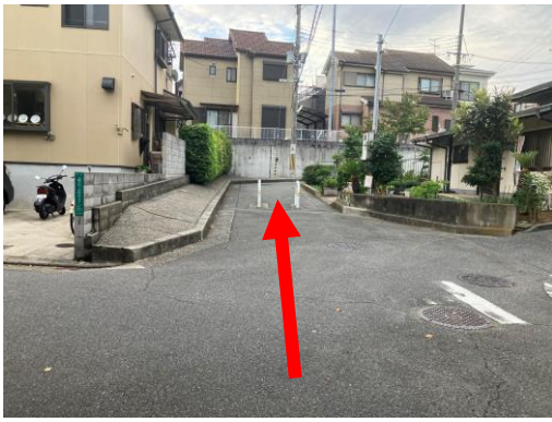
9. 池を通りこえると進入禁止の白ポールが見え、そこを 入っていく